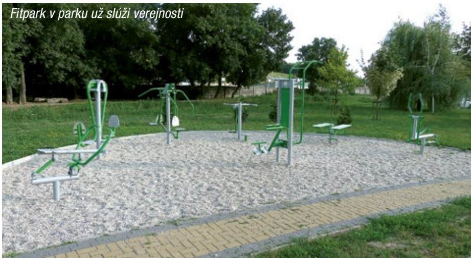
Fitpark v parku už slúži verejnosti

No nie len zábava nás sprevádzala prvým polrokom. Boli to aj pochmúrne udalosti, kalamity, sklamanie a tiež rôzne investičné akcie. Od začiatku roka sme sa zamerali na prípravu projektových dokumentácií, ktoré sú nevyhnutné k uchádzaniu sa o rôzne dotácie. Jednou z najväčších bola príprava projektovej dokumentácie rekonštrukcie a modernizácie športového areálu. Obec pristúpila k tomuto